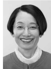
ネットワーク 三芳