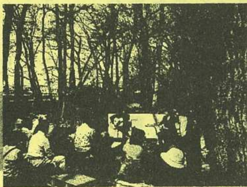
地域ネットワークの活動から

三富新田、平地林を多くの人に知っていただき、残していきたい。そんな思いをのせて、これからもコンサートを続けていきたいと思えます。