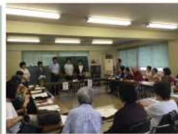
2019年度の総代会の様子